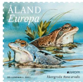
Europa – Uhanalaisia lajeja