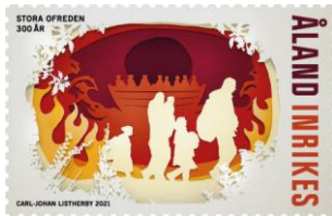
Isoviha 300 vuotta