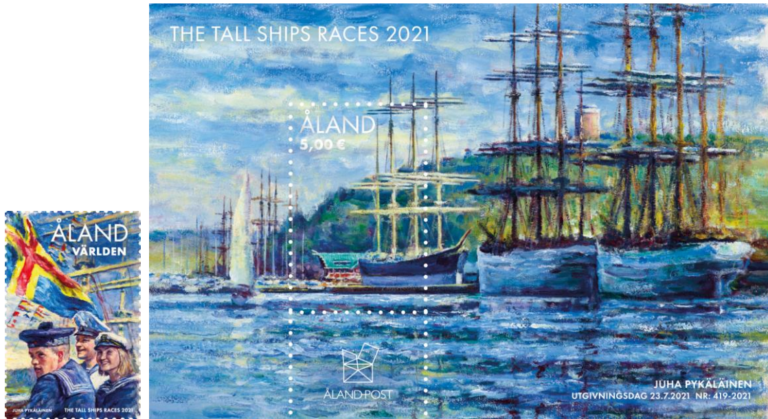
The Tall Ships Races 2021