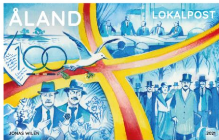
Ahvenanmaa 100 vuotta