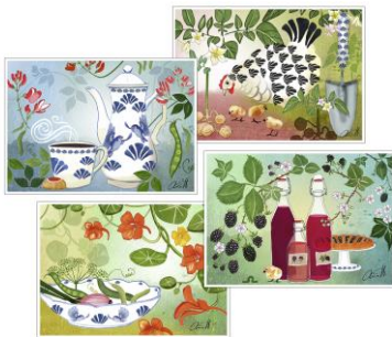
Ehiökortit – Kevät vihertää